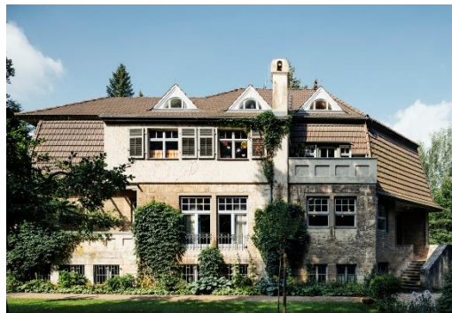
Haus Hohe Pappeln.