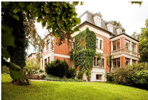
Nietzsche-Archiv Weimar.

Friedrich Nietzsche bezog 1897 mit seiner Schwester die Villa »Silberblick«. Er verstarb hier am 25. August 1900. Nietzsches Schwester beauftragte 1902 den Architekten Henry van de Velde mit der Umgestaltung und Neueinrichtung des Erdgeschosses. Heute zählt diese Arbeit zu seinen gelungensten Schöpfungen. Das Nietzsche-Archiv umfasst zahlreiche Dokumente, Fotos und Andenken an den Philosophen, eine modernisierte Ausstellung dokumentiert die Geschichte des Hauses und dessen Rolle im Nietzsche-Kult des Nationalsozialismus.