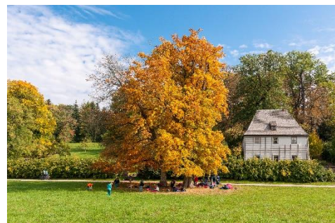
Goethes Gartenhaus im Park an der Ilm.

www.klassik-stiftung.de/schillers-wohnhaus