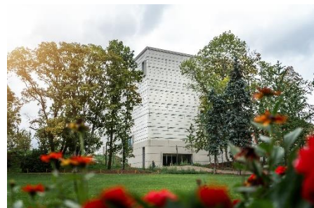
Sicht auf das Bauhaus-Museum aus dem Weimarhallen-Park.

www.klassik-stiftung.de/bauhaus-museum-weimar