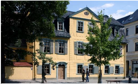
Schillers Wohnhaus und Museum.

Aktuelle Ausstellung: „Abenteuer der Vernunft. Goethe und die Naturwissenschaften um 1800.“ vom 28.08.19 bis 05.01.20. Die Klassik Stiftung Weimar präsentiert in dieser Ausstellung erstmals die naturwissenschaftliche Sammlung Goethes. Zwischen 1770 und 1830 entstanden die Grundlagen für viele heutige Zweige der Naturwissenschaften. Goethe nahm regen Anteil an dieser Entwicklung und führte eigene Experimente durch. www.klassik-stiftung.de/schiller-museum