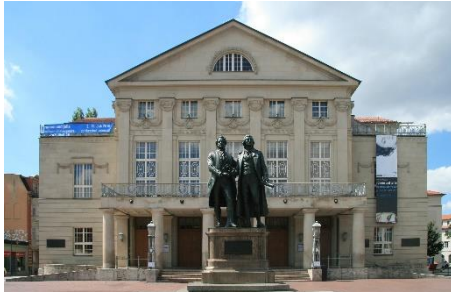
Das Deutsche Nationaltheater mit Goethe-Schiller-Statue.

Deutsches Nationaltheater und Staatskapelle Weimar www.nationaltheater-weimar.de