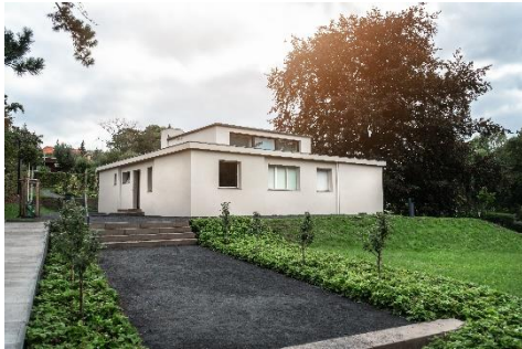
Das Haus am Horn.