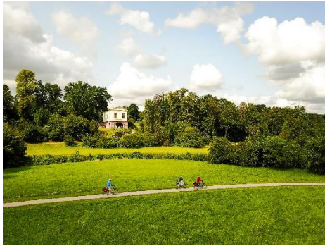
Der Ilmtal-Radweg mit Blick auf das Römische Haus in Weimar.

Thüringer Tourismus GmbH * Willy-Brandt-Platz 1 * 99084 Erfurt Mandy Neumann, Tel. 0361-3742-219, m.neumann@thueringen-entdecken.de Theresa Wolff, Tel. 0361-3742-240, t.wolff@thueringen-entdecken.de Fax: 0361-3742-299, Internet http://presse.thueringen-entdecken.de