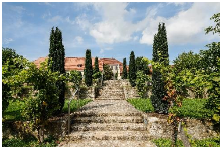
Blick auf den Hotel Resort und das Restaurant Reinhardt's im Schloss.