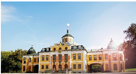
Schloss Belvedere.

www.klassik-stiftung.de/herzogin-anna-amalia-bibliothek